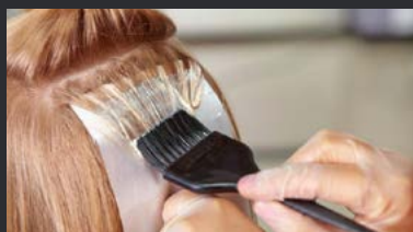
آرایشگاه و سالن زیبایی